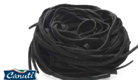
Tagliolini al Nero di Seppia