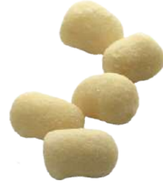
Gnocchetti de Patatas