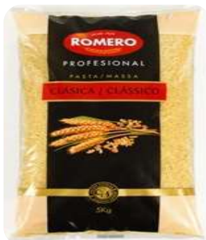
Fideo Cabello de Ángel