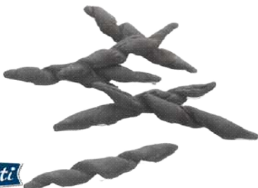
Stringoli al Nero di Seppia