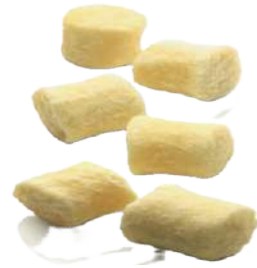
Gnocchi Casarecci de Patatas y Huevos