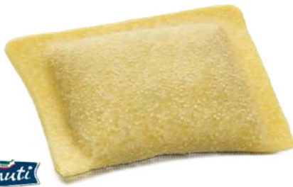
Raviolacci - Linea Delizie -