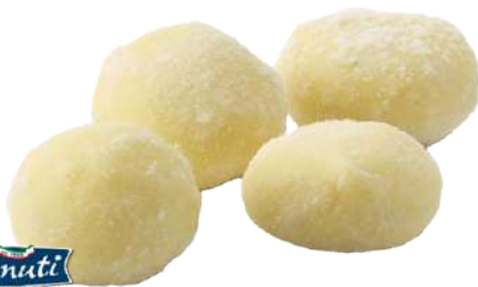
Gnocchi rellenos de Setas Boletus