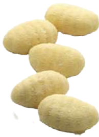
Gnocchi de Patatas