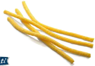
Passatelli de Parmigiano Reggiano