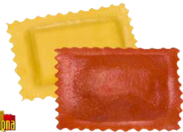
Ravioli Amarillo y Rojo