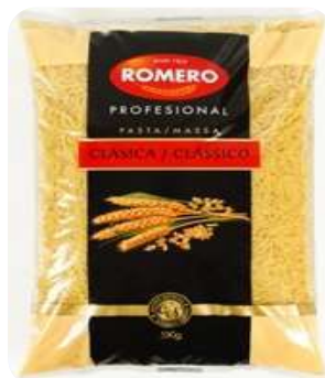
Fideo Entrefino n°2