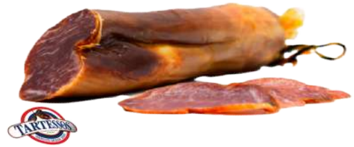
Caña de Lomo Iberico de Cebo