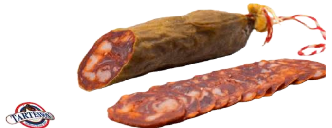
Chorizo Ibérico de Bellota