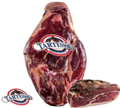
Jamón Ibérico Deshuesado Bellota / Cebo de Campo / Cebo