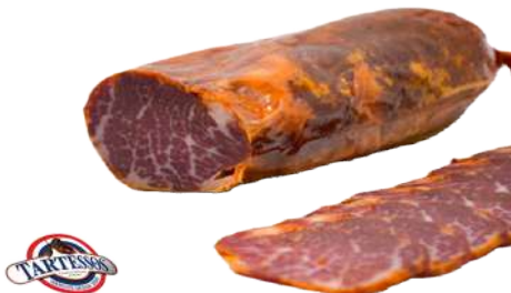
Lomito Ibérico [Cabecero Embuchado]