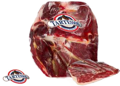
Paleta Ibérica Deshuesada Bellota / Cebo de Campo / Cebo