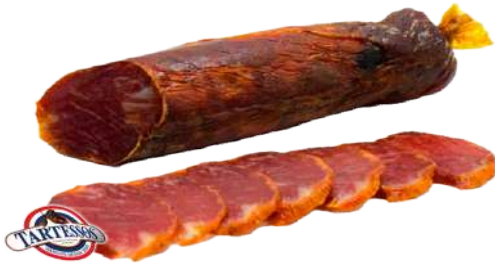
Caña de Lomo Iberico de Bellota