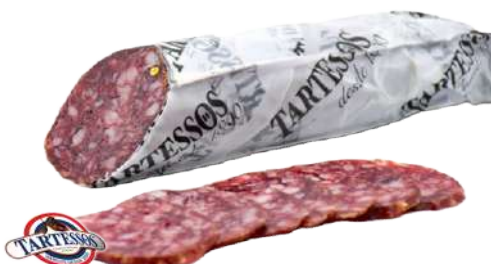
Salchichón Ibérico de Bellota