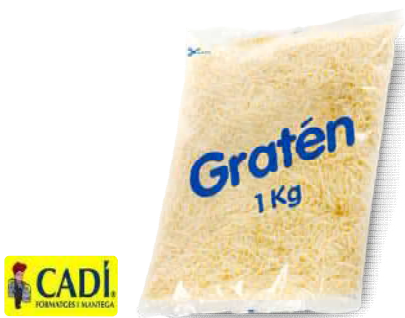
Queso Rallado Graten