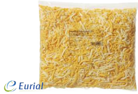
Queso Mezcla 3 Quesos