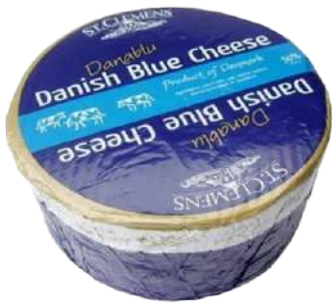
• Queso Azul Danés