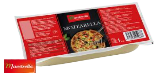
Mozzarella Pura 40% M.G.