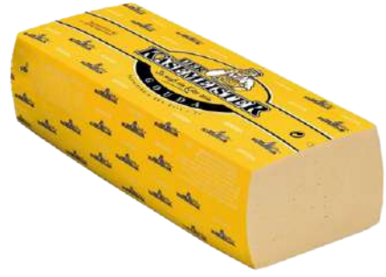
• Queso Gouda en Barra