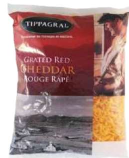
Queso Cheddar Picado