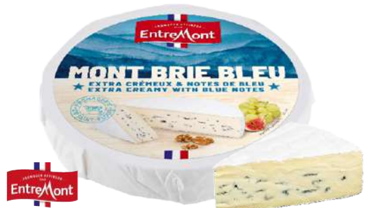
• Queso Brie - Azul