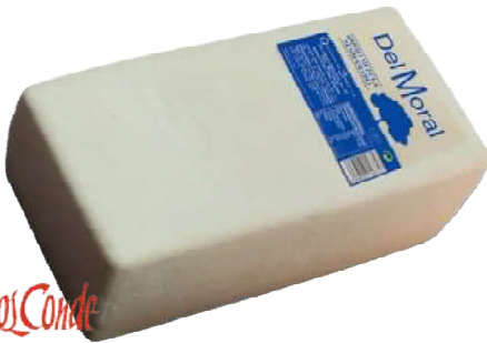
• Queso en Barra Semi Mezcla Suave