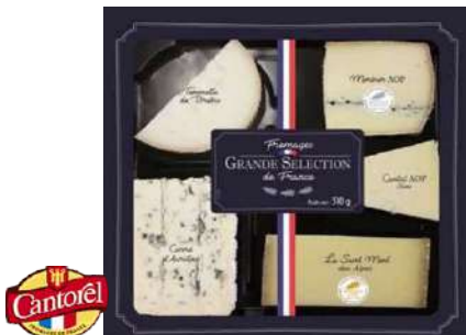
Bandejas 5 Quesos "Grande Selection"