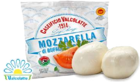
Bocconcini de Búfala Campana