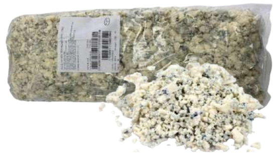
• Queso Azul Danés Desmigado