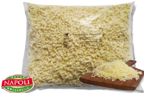
Mozzarella Pura "NAPOLI"