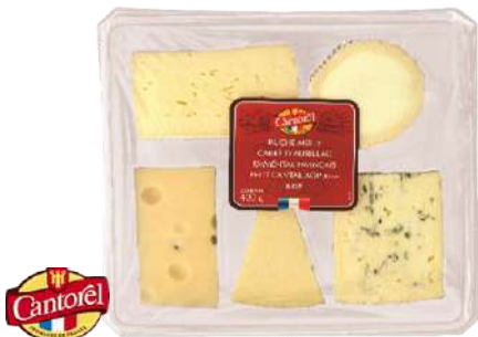
Bandejas 5 Quesos "Francia"