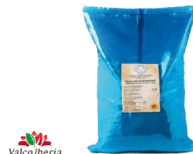
Pecorino Romano Grattugiato