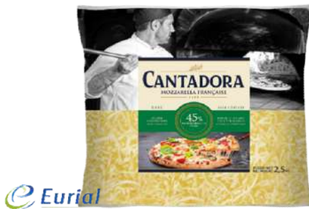
Mozzarella Pura 45% M.G.