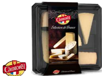
Bandejas 5 Quesos "Selection Francia"