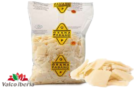
• Queso Parma Grana Padano en Escamas