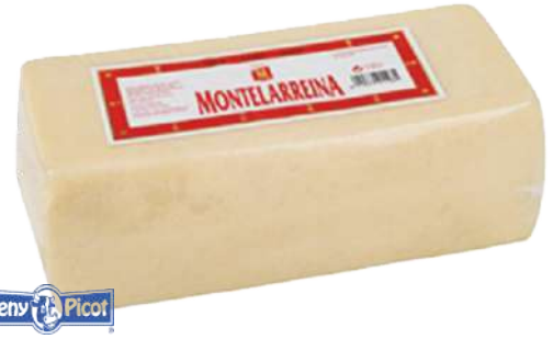
• Queso en Barra Semi Mezcla