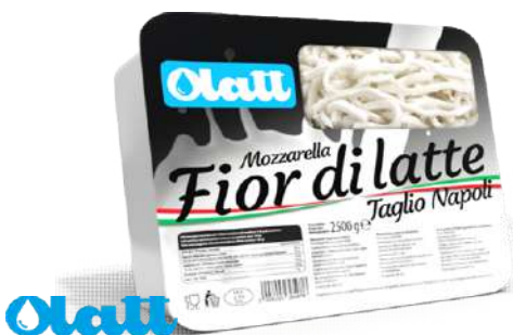
Mozzarella Fior di Latte