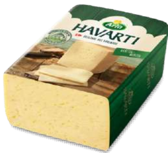
· Queso Havarti Danés 60% M.G.