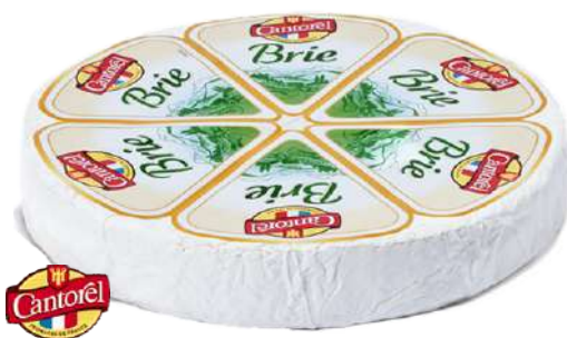
• Queso Brie 60% M.G.