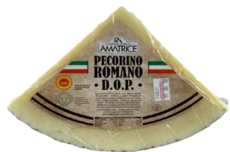
· Queso Pecorino Romano