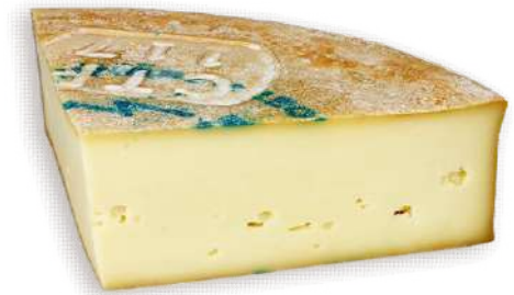
• Queso Fontina D.O.