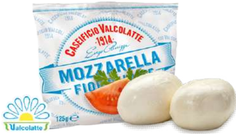
Bocconcini de Vaca