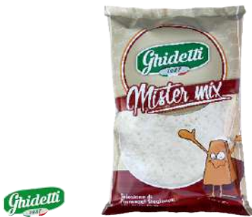
Queso Mix en Polvo Tipo Parma