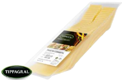
• Queso Emmental Lonchas