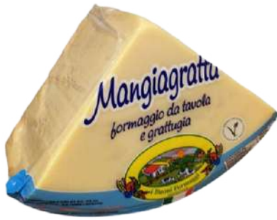
· Queso Mangiagratta