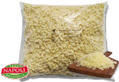
Mozzarella Mezcla "30/70"