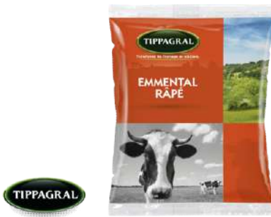
Queso Emmental Rallado