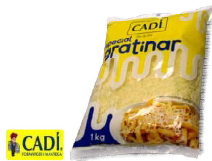
Queso Rallado "Especial Gratinar"