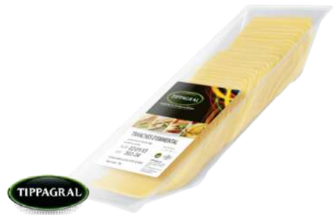
• Queso Gouda Lonchas