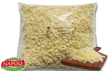
Mozzarella Mezcla "70/30"