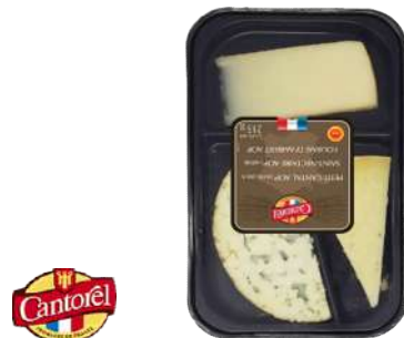
Bandejas 3 Quesos