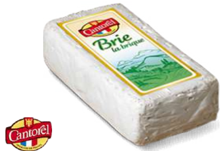
• Queso Brie en Barra 50% M.G. "LA BRIQUE"