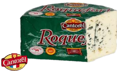
• Queso Roquefort D.O.