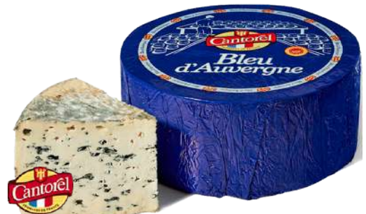
• Queso Azul Francés