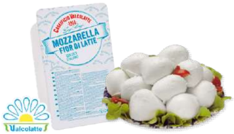
Ciliege de Vaca