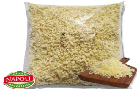
Mozzarella "LA MOZZARELLA"