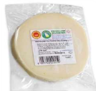
· Queso Provolone Dolce Porciones