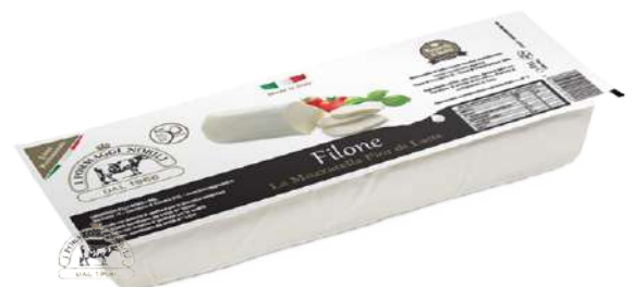
Mozzarella Fior di Latte