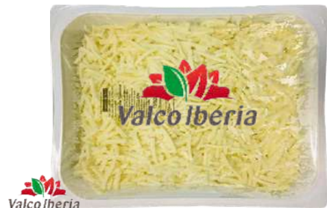
Mozzarella Julienne y Cubettata