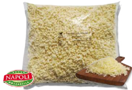
Preparado Lacteo "STAR"