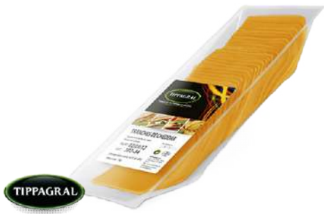
• Queso Cheddar Lonchas