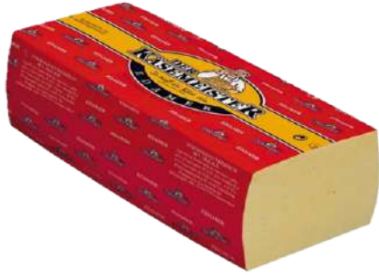
• Queso Edam en Barra