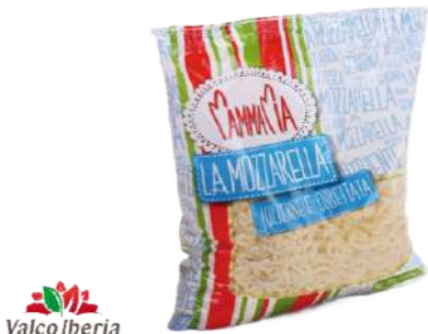
Mozzarella Julienne y Cubettata