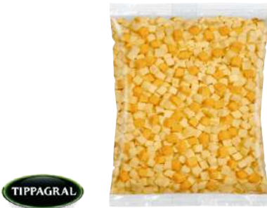
• Mezcla de Gouda / Cheddar