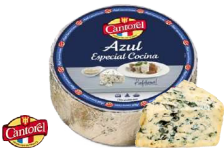
• Queso Azul Francés - Especial Cocina