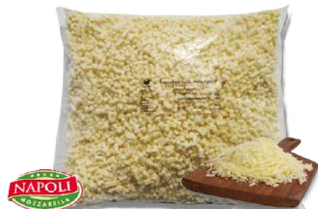
Mozzarella Mezcla "50/50"