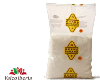
Queso Grana Padano en Polvo