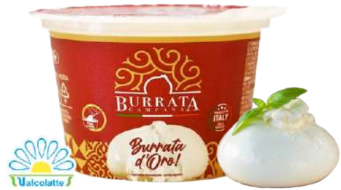
Burrata de Búfala